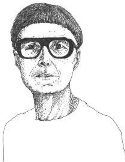
MATALI CRASSET - prevajalec -