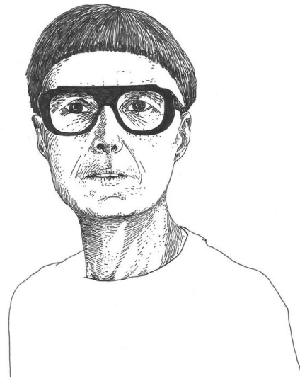
MATALI CRASSET - prevajalec -