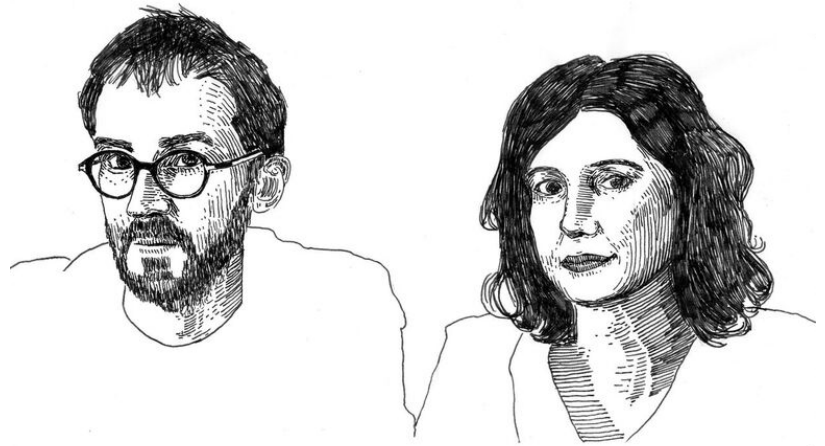
STUDIO FOLDER - prevajalec -