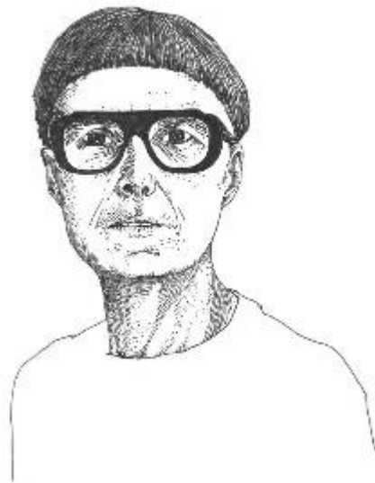
MATALI CRASSET - prevajalec -